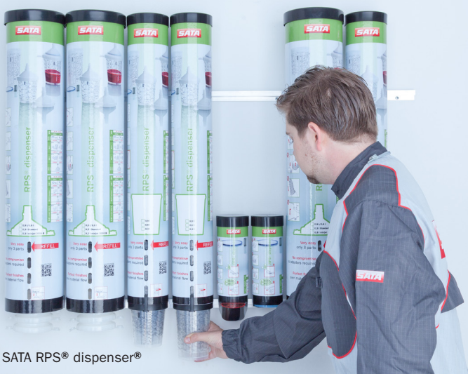
SATA RPS® dispenser®