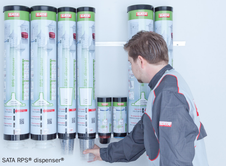
SATA RPS® dispenser®