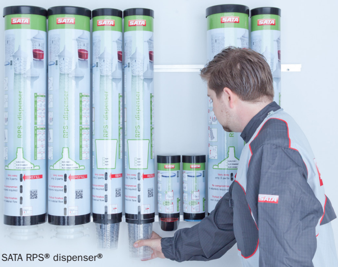
SATA RPS® dispenser®