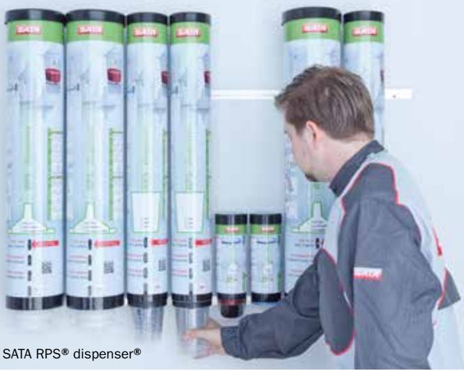
SATA RPS® dispenser®